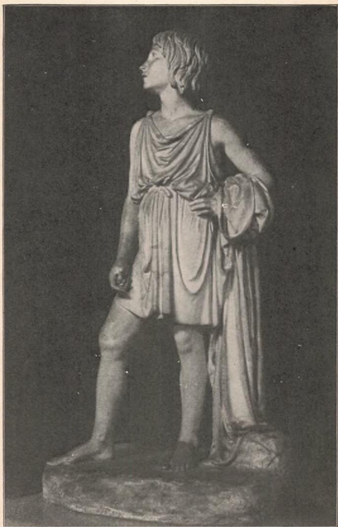
Den lyttende Yngling fra Thorvaldsens Johannes-Gruppe. Skænket Ordrup Gymnasium af en Kreds af Forældre til Skolens 40 Års Fødselsdag d. 3—11—1913.