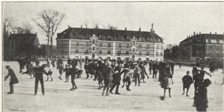
Det store frikvarter på skolens isbane.

For drengenes vedkommende har undervisningen og øvelserne spændt over et stort felt, men såvel under den egentlige gymnastik som ved de frie idrætsøvelser