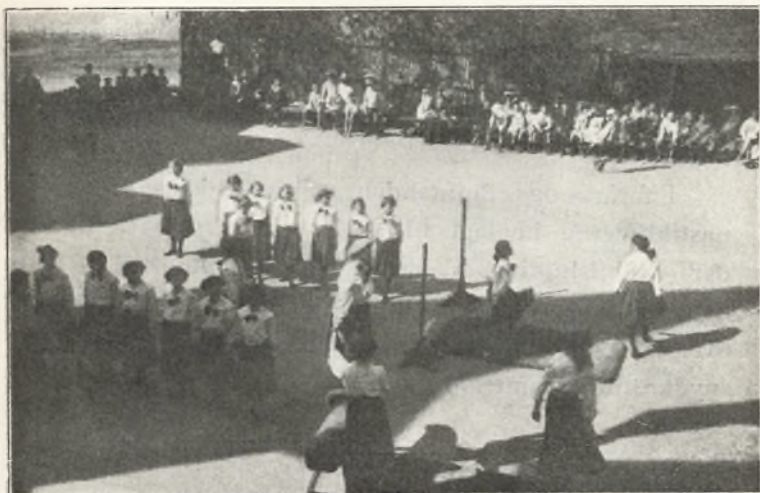
Opvisning på skolen af pigernes Ålborghold.

nyttet til øvelser i det fri, lege og boldspil (langbold og kurvbold).