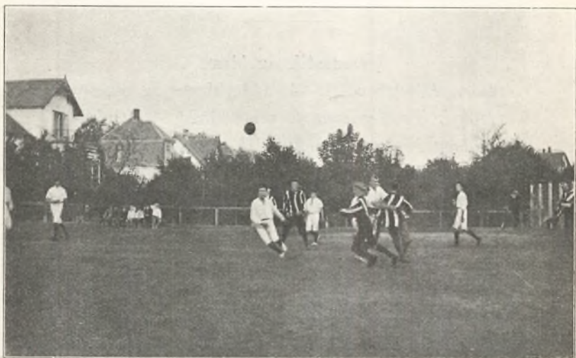
Fra skolens mindre idrætsplads (håndboldkamp med Helsingør h. almenskole).

For pigernes vedkommende er der undervist efter 'dansk kvindegymnastik's regler. Adskillige af gymnastiktimerne er — når vejret har tilladt det — be-