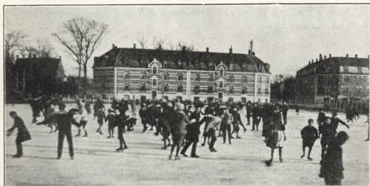
Det store frikvarter på skolens isbane.