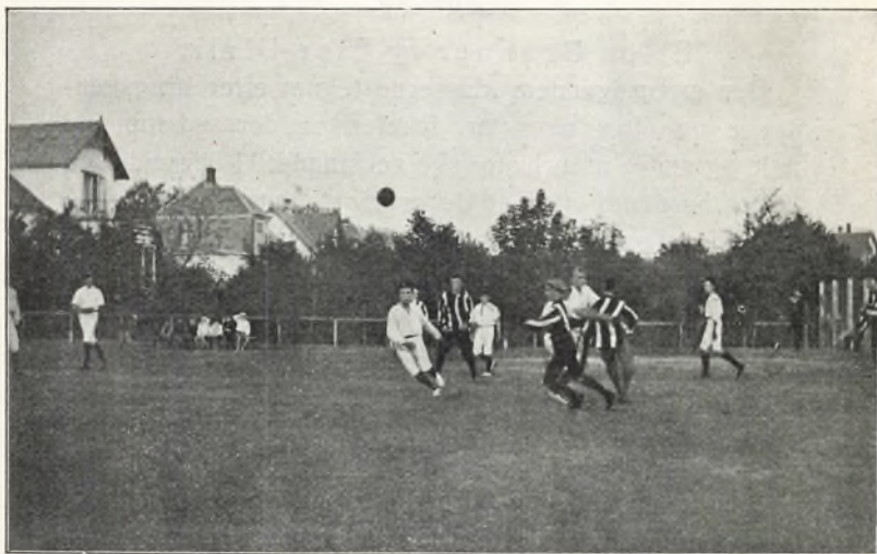
Fra skolens mindre idrætsplads (håndboldkamp med Helsingør h. almenskole).