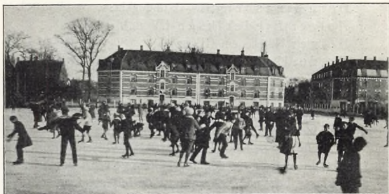
Det store frikvarter på skolens isbane.