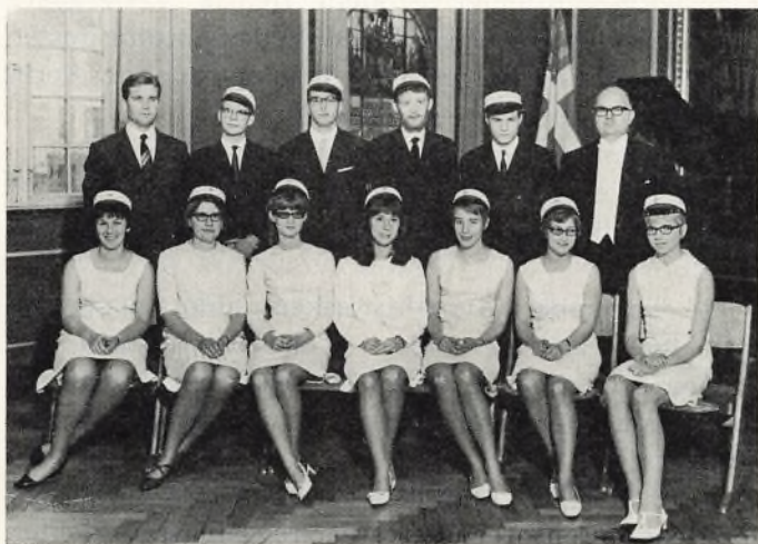
Studenterholdet — 4. november 1966