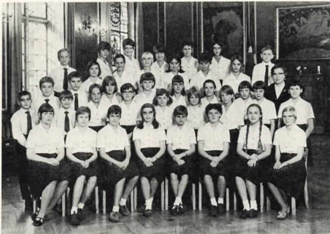
Margrethekoret 1966 er klar til indsats

16. april: Koret indsang på stereo-bånd i skolens festsal 5 sange med det formål at få lavet en gram-