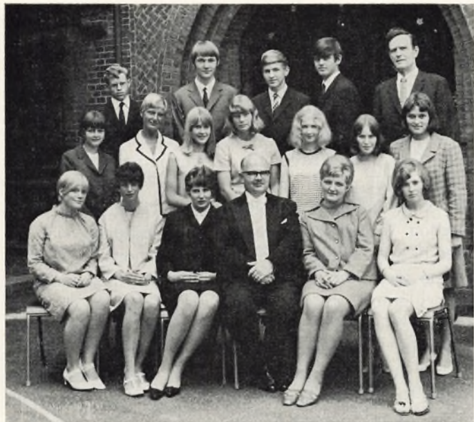
Realistholdet — 14. juli 1967