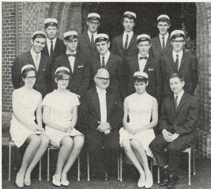
Studenterholdet — 30. juni 1967