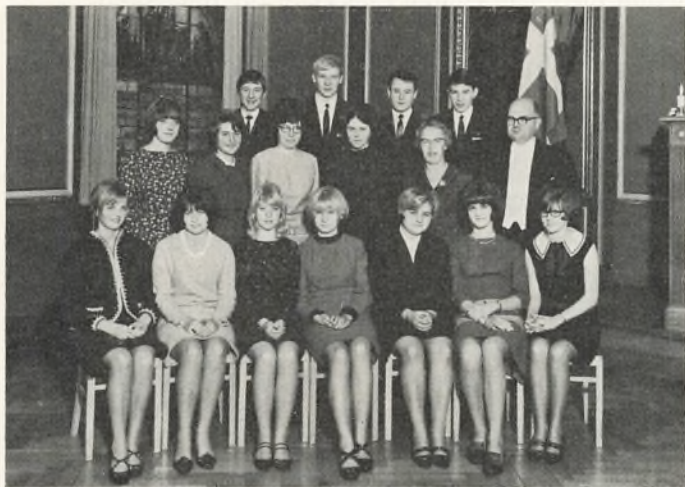
Realistholdet — 30. november 1966