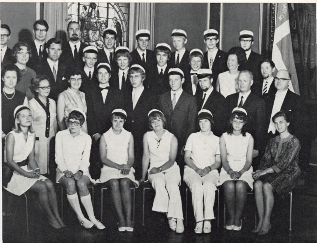
Studenterne med deres lærere, fotograferet ved dimissionen den 26. 6. 1969.