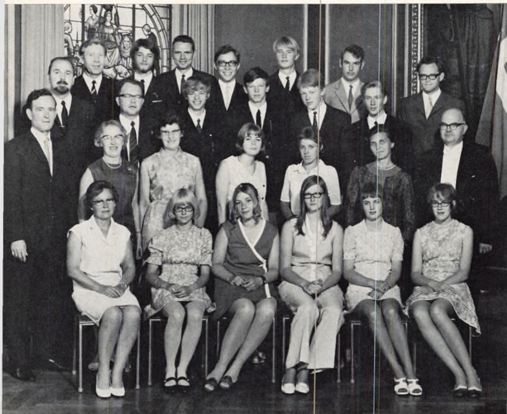
Realisterne med deres lærere, fotograferet ved dimissionen den 26. 6. 1969.