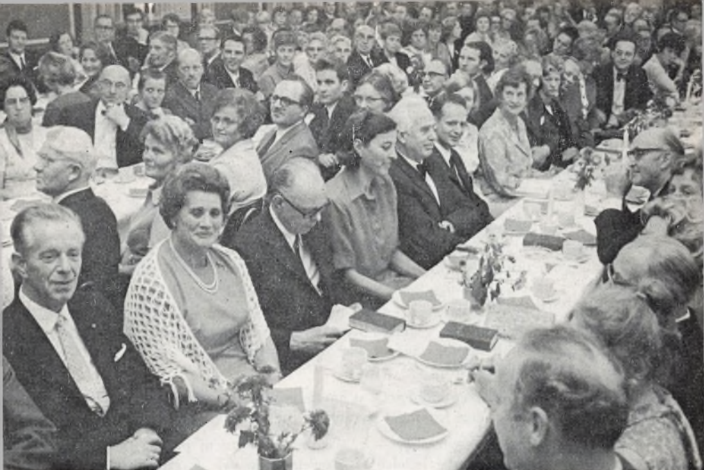
Et udsnit af deltagerne i fødselsdagsfesten om aftenen den 15. oktober