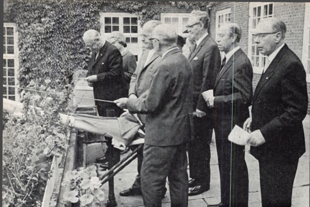
De tidligere lærere overdrager deres gave