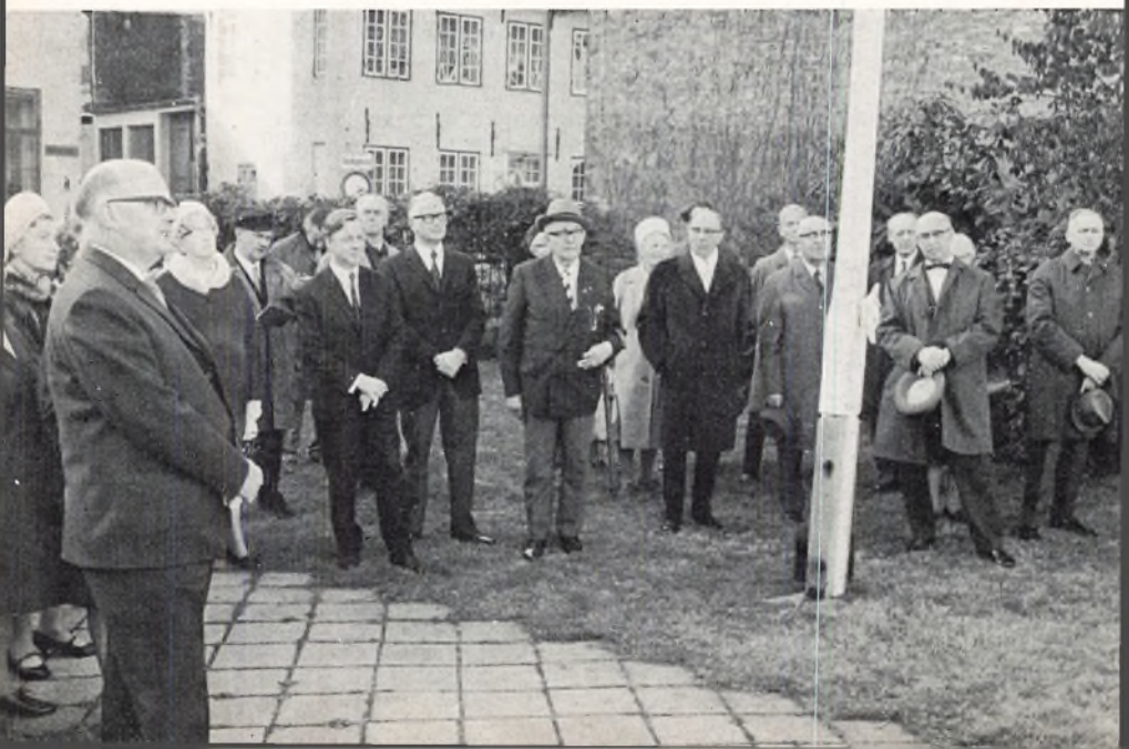
En kreds af skolens allertidligste elever, samlet ved afsløringen af mindepladen på „Hjemmet“