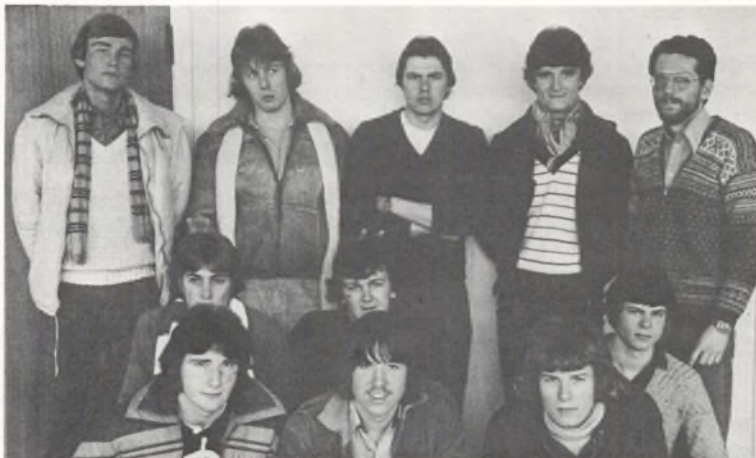
Danmarksmestrene i Gymnasieskolernes Håndboldturnering 1979

Hvis rejsehjemmel i sådanne tilfælde ikke returneres i løbet af 1 uge, så forbeholder amtskommunen sig ret til at kræve sit udlæg refunderet hos eleven.