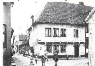
Helsingørs ældste bindingsværkshus

Strandgade 27: Denne bindingsværksgård er den ældst daterede i Helsingør. Som det ses er den opført i 1577. Før i tiden var der her, som i talrige andre af Helsingørs gamle huse, indrettet værtshus - »Peter i Ankerets datter«.