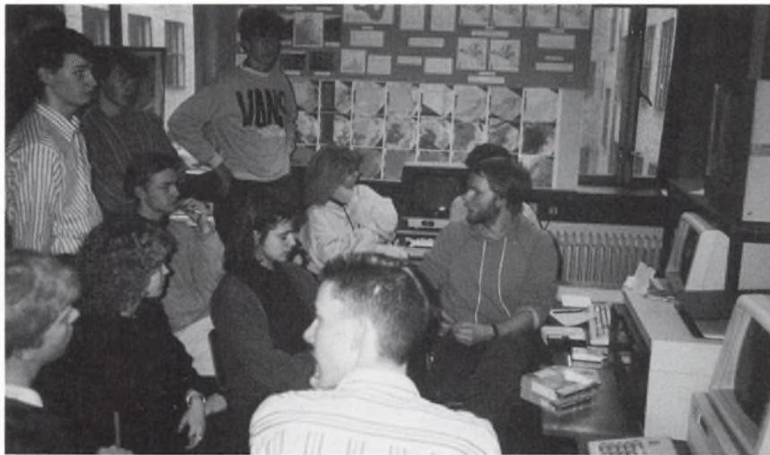
2xzFM intenst lyttende på Geologisk Museum og på Geografisk Institut