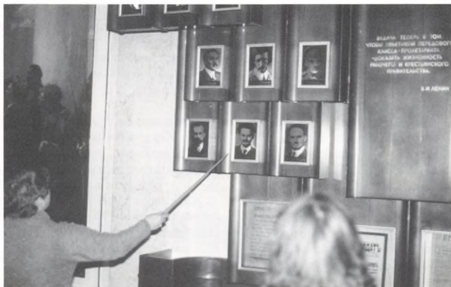
Guiden på Revolutionsmuseet viser Trotskij's billede frem for 2y

Hvad vi dér var vidne til, er den frie samtale - som den tyske filosof Jürgen Habermass kalder ' den herredømmefri kommunikation ' - og et vidnesbyrd om den åbenhed, glasnost, som Gorbatjov har indledt overalt i Sovjet. Og når vi netop i år er optaget af Glasnost og hver dag i TV og aviser får nye vidnesbyrd om det bl.a. i form af historiske og nutidige afsløringer, så hænger det måske også sammen med, at vi i år fejrer 200 års jubilæet for Den franske Revolutions erklæring om menneskerettighederne den 26. august 1789.