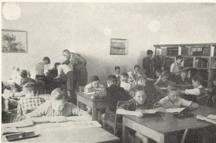
Læsestuen i Borgerskolen, Ingerslevs Boulevard.

1. April 1939 fandtes i Børnebibliotekerne 17627 Bind (1938: 17641) og i Lærerbibliotekerne 3966 Bind (1938: 3868). I Børnebibliotekerne fandt i Aaret 1938—39 97507 Udlaan Sted.