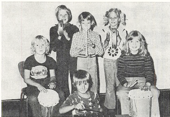
Undervisning i P-fagene.

Fagkredsen består af en række obligatoriske fag, som eleverne skal modtage undervisning i, og en række tilbudsfag, som skolen skal tilbyde eleverne, men det står eleverne frit for, om de vil modtage de tilbudte fag. I tilbudsfaget tysk deltog 88 % af eleverne i henholdsvis 8. klasse og 9. klasse. Latin er tilbudsfag i 9. klasse, og 39 % af eleverne modtog dette tilbud. Endelig er der en række valgfag, som er frivillige