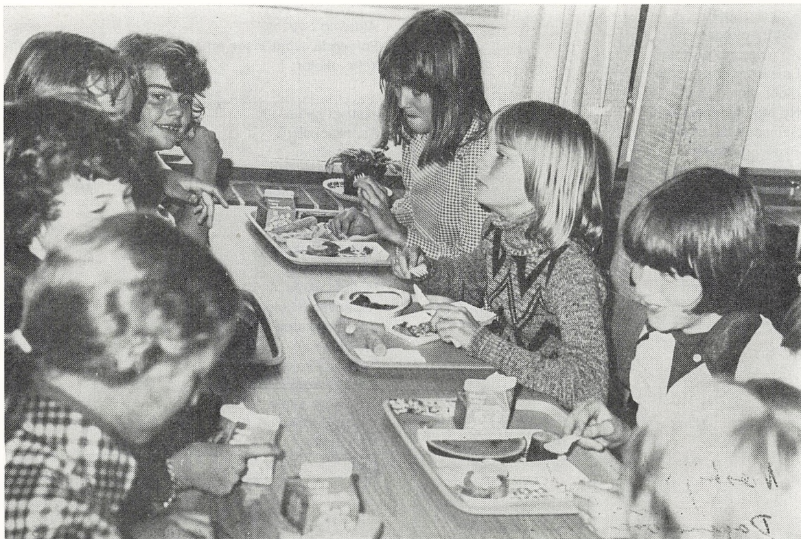
Spisepause i skolekantin.