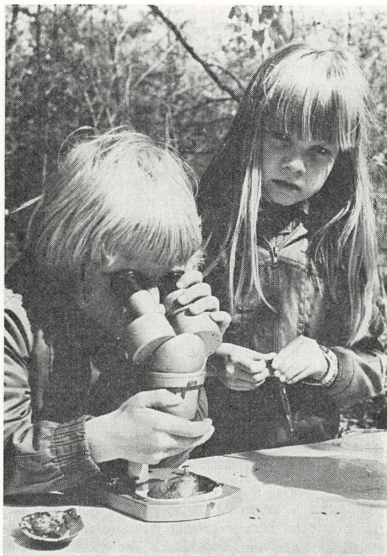
Biologiundervisningen i skoleskoven.

Blandt øvrige emner, der er arbejdet med, kan nævnes skovbundens mikrofauna, svampe i skovbunden, bladminer på træer og buske, skadelige insekter og svampe på skovtræer, vedplanternes galler, dyrespor, jordbundsprofiler.