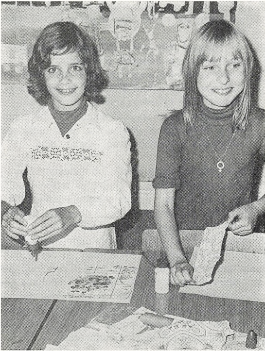
Undervisning i P-fagene.