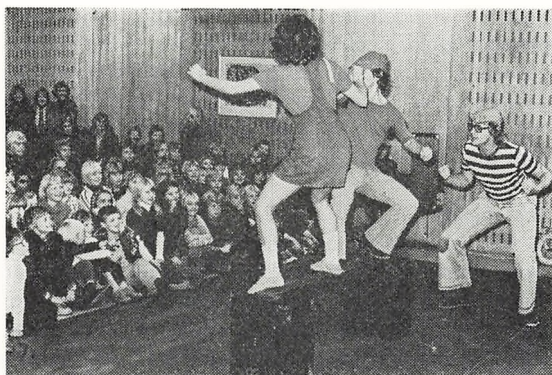
Fra teaterforestillingen: »Hvorfor gør du det«, opført af Gruppe 38's børneteater.

»Mormor, Morten og Den Flinke hr. Jørgensen« er opført ved 29 forestillinger i maj/juni for de små elever.