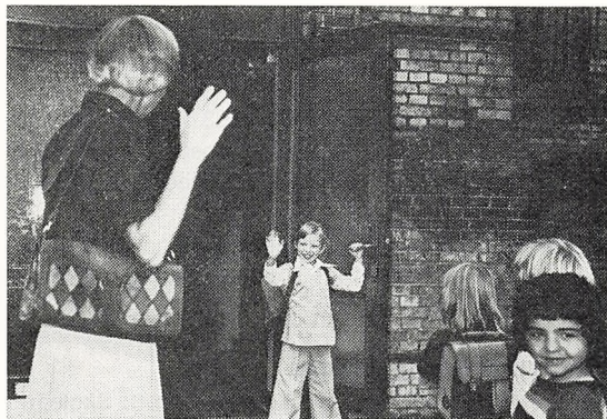
Den første skoledag.

Etablering af nyt sløjdlokale i tidligere kælderlokaler.