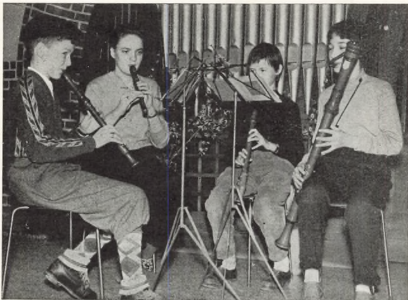
Skolens blokfløjte kvartet

Turen startede fra skolen kl. halv otte morgen, og kl. syv om aftenen var vi hjemme igen. Dagen havde på en lærerig måde illustreret timernes undervisning.