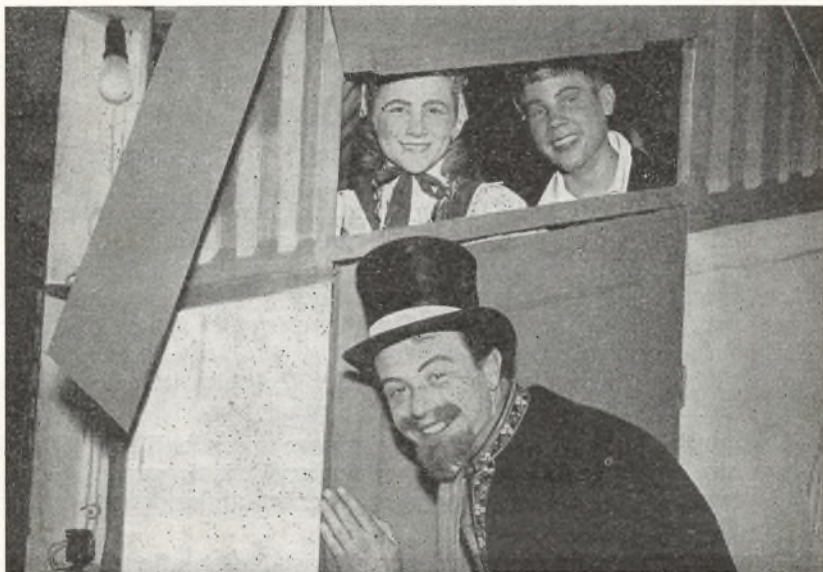
„En søndag på Amager“

13. april. Skolefest for skolens afgangselever med pårørende. Der spillede »En søndag på Amager« instrueret af lærerinde frk. C. Kjærulf og hr. overlærer A. Beyer. Hr. lærer V. Johansen havde den musikalske ledelse, og hr. overlærer Sv. Blinkenberg havde malet dekorationerne.