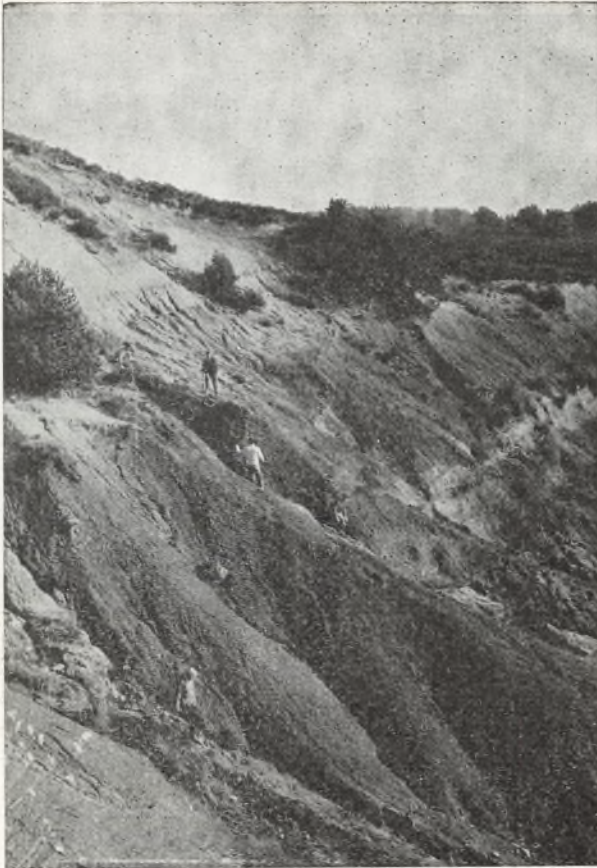
IV B på geologisk ekskursion

Turens hovedmål var at lade landskabet fortælle om Danmarks tilblivelse i tertiærtidens varme, sumpede laguner og under istidens vældige gletsjermasser.