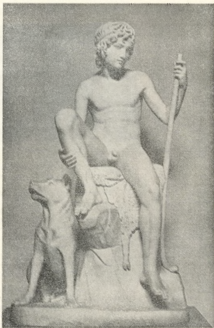
Thorshalsen: En byrdestreng