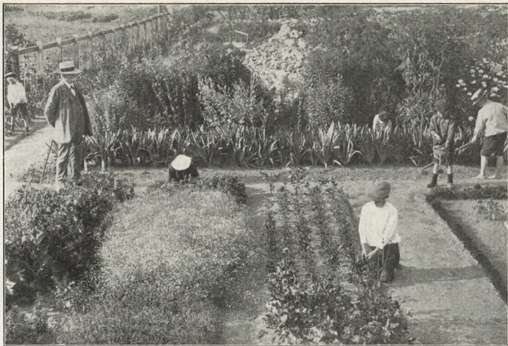
Skolehaven ved Østre Skole