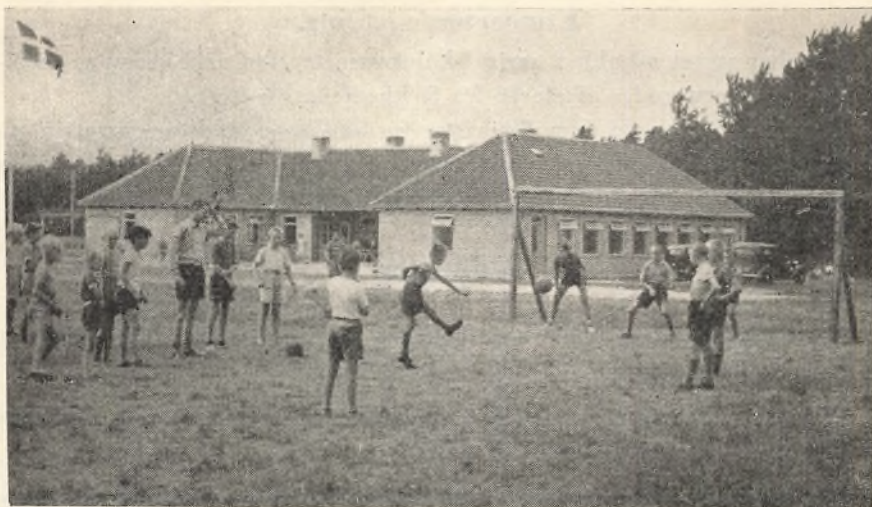
Feriekolonien i Gedesby.