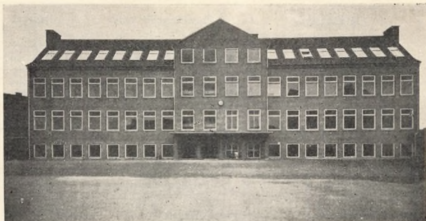
Nørre skoles nybygning.