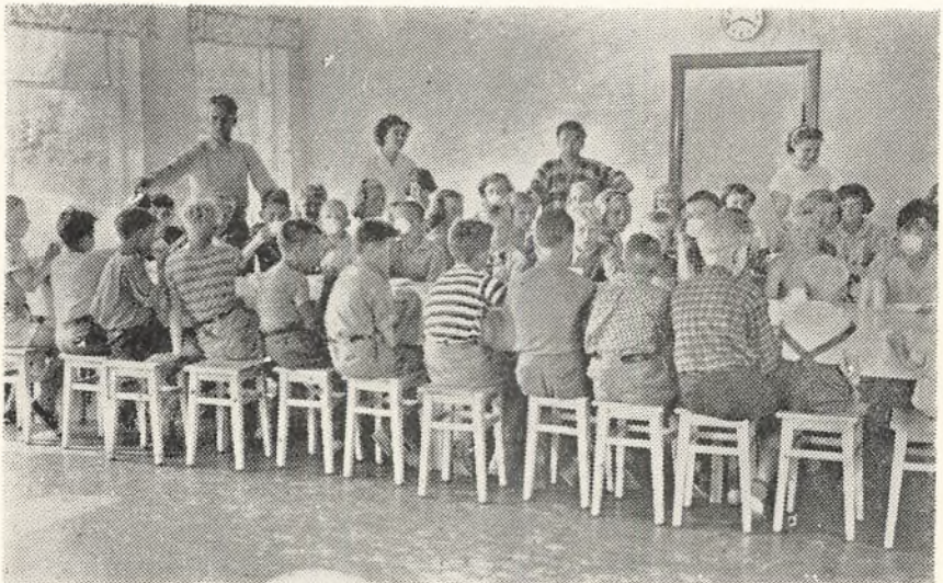
Spisesalen i Gedesbylejren.