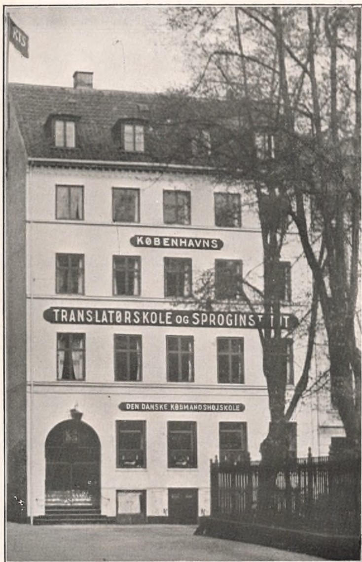
Translatørskolen (set fra Amagertorv)