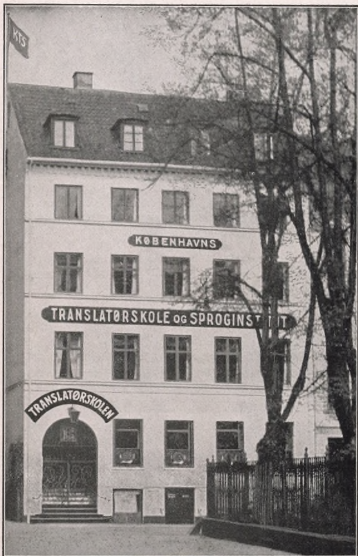
Translatørskolen (set fra Amagertorv)