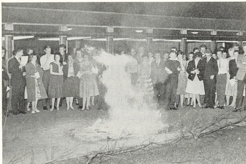
Vårballet, Valborgaften 1959.