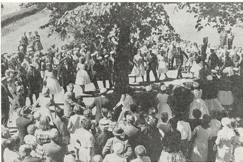
Det første studenterhold danser omkring „Gldsaxe-pigen“.