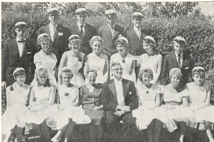
De sproglige studenter 1959.