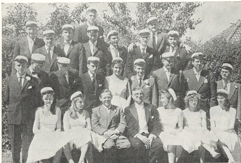
De matematiske studenter 1959.