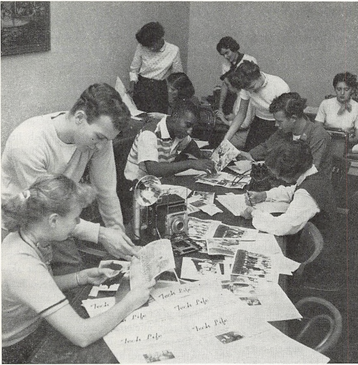
Redaktions- og medarbejderstaben ved et amerikansk skoleblad, »Tech Life«, i arbejde.

tiden er der nogle elever som, når de bliver 16 år, holder op med at gå i skole. Men de fleste amerikanske unge går i skole hele 12 år og kommer ud fra »High School«, når de er 17–18 år.