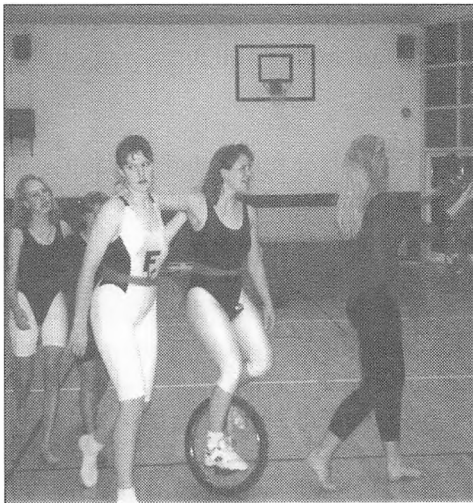
Opvarmning til Kongskilde markedet.

dere, Køkkenassistenter og Almenelever. 10. klasse havde endnu lidt i vente, den mundtlige eksamen lå i juni, så først den 16. juni kunne vi sige farvel til dem.