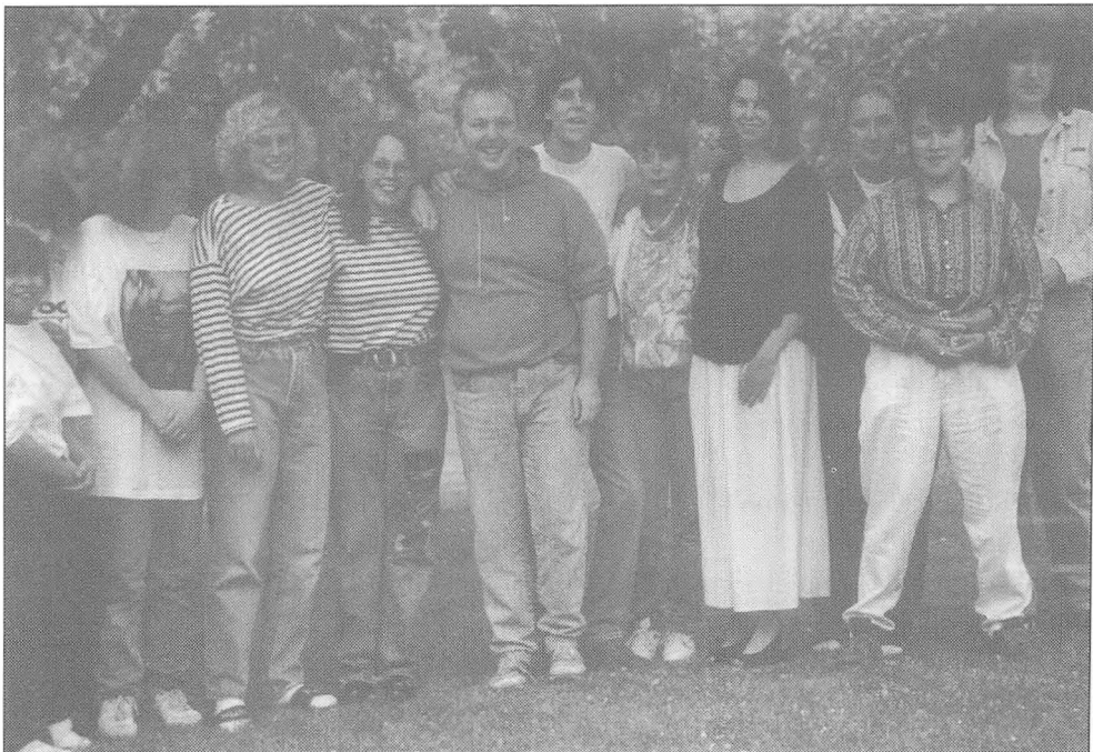
AH forår 1993