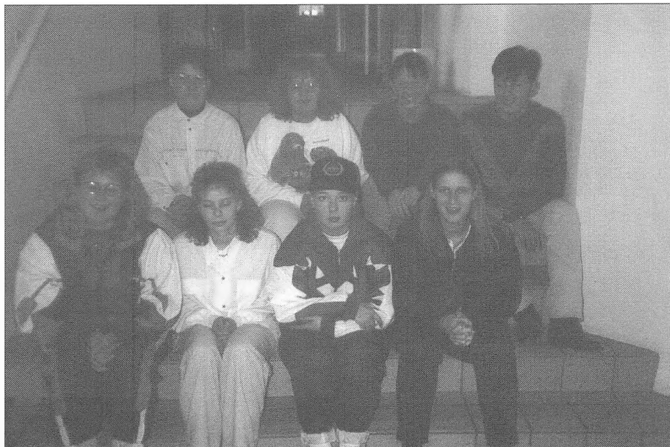
Studieforberedende, efterår 1993