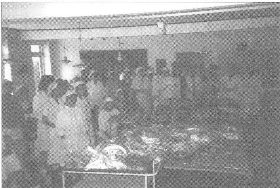
Den store BAGEDAG. 3 køkkeners gærbrødsproduktion en fredag i august 1993.