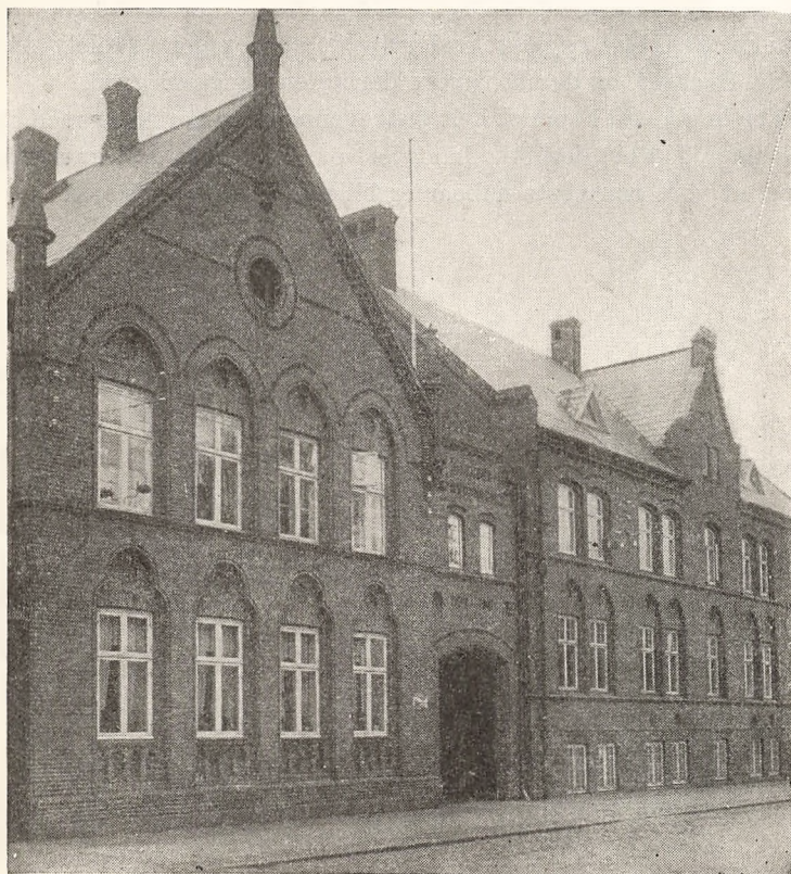
SKOLEN PÅ NDR. BANEVEJ

Og på Skolen paa Ndr. Banevej er livet blevet levet, rigt og afvekslende, og man har glædet sig over de bedre pladsforhold, siden de større børn er flyttet ud på Frederiksborg byskole.