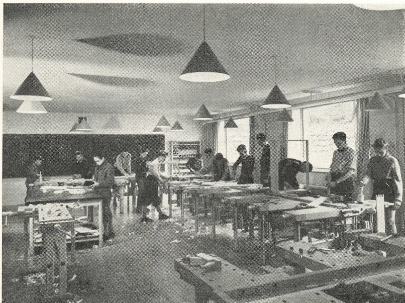
Der arbejdes med liv og lyst.