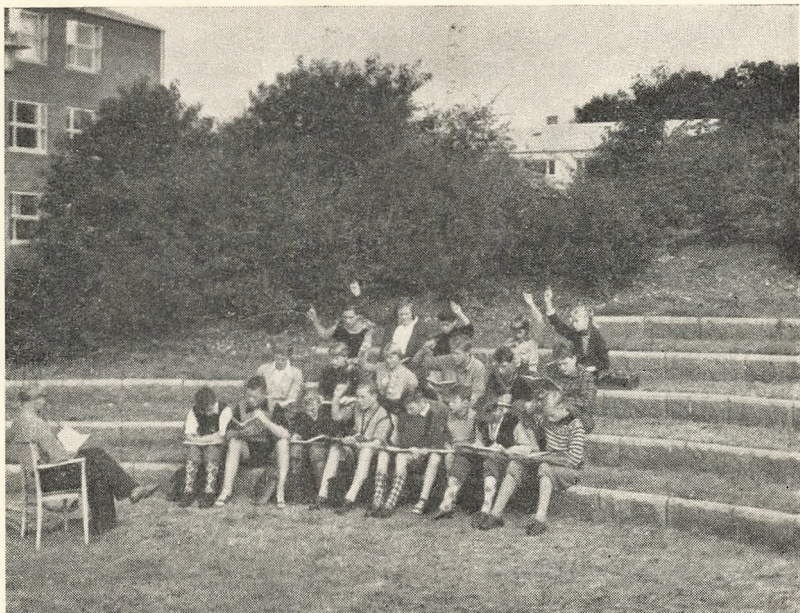
Skoletime i det fri.

hverv stiller, samt de muligheder, de indebærer. Samtidig med, at eleverne har fået kendskab til erhvervene, har de også fået deres ønsker om fremtidigt erhverv bragt ind i bestemte baner. Siden sendtes eleverne ud på besøg i virksomheder, hvor de ønskede erhverv udøves. Disse besøg strakte sig over tre dage. De har haft den allerstørste betydning, idet de enten har bestyrket eller svækket ønsket om selv at blive udøvende indenfor pågældende erhverv. Efter at besøgene var afsluttet, skrev hver elev en udførlig rapport om oplevelser og indtryk under besøget. Rapporterne viser med al tydelighed værdien af erhvervsvejledning i forbindelse med virksomhedsbesøg.