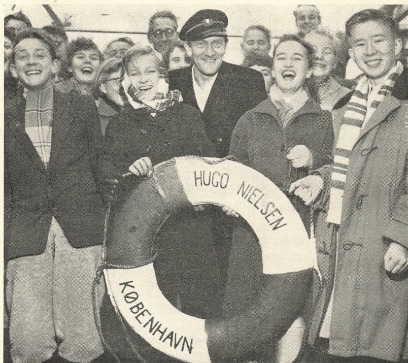
Et muntert glimt fra besøget på vort adoptivskib.