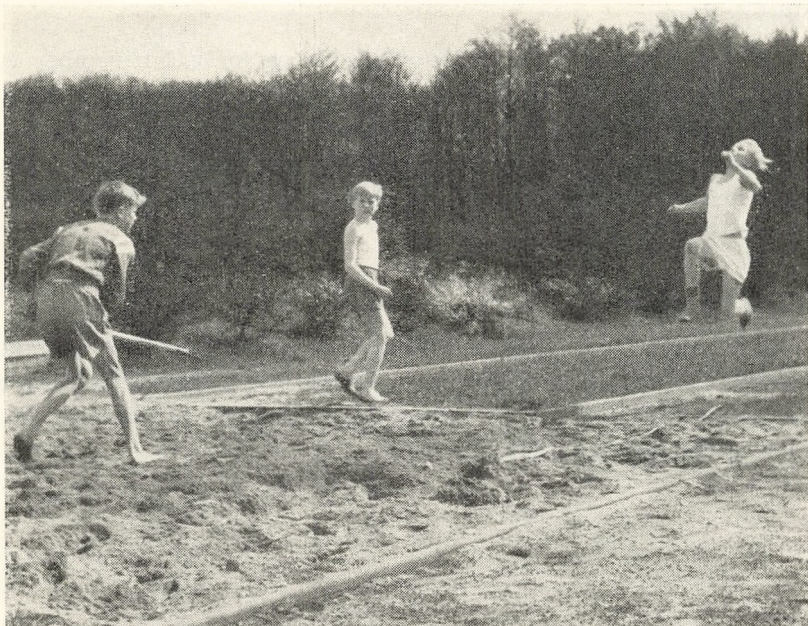
Bliver rekorden slået?