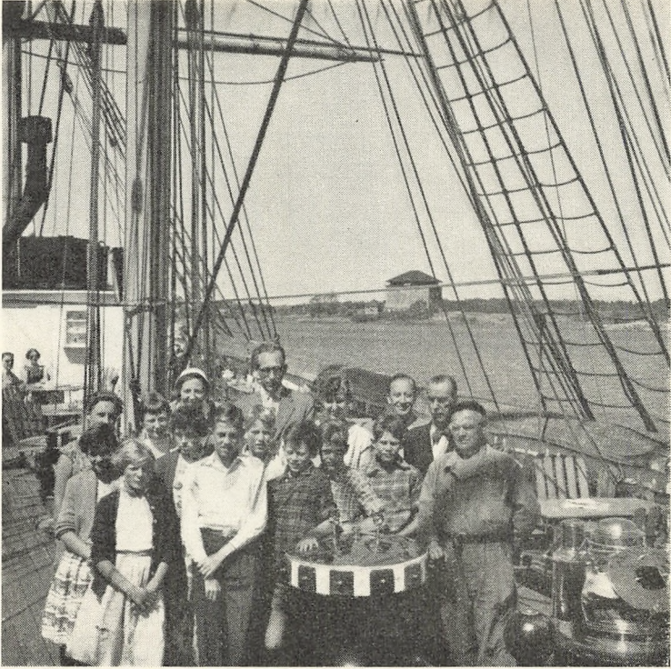
I den finske skærgård.