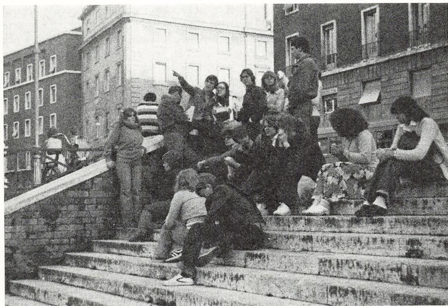
2 a i Rom

ikke op, før han havde fået overtalt et par stykker, der så til gengæld fik presset prisen kendeligt ned. Vi skulle også have set Colosseum, men det blev dog kun udefra, da der var lukket.