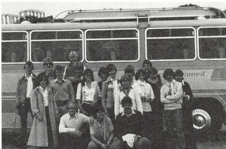
2 x i Athen

men yderst interessante museum. Efter dette ventede der os en mindre bjergbestigning over tempelområdet, videre over teatret og endelig på toppen lå det gamle stadion. Efter at have besøgt den hellige kilde, spiste vi i Ny Delphi. På vejen hjem stoppede bussen i en bjerglandsby, hvor man kunne købe billige skindvarer og tæpper. Igen den dag var det mærkt i Athen, da vi endelig kom »hjem«.