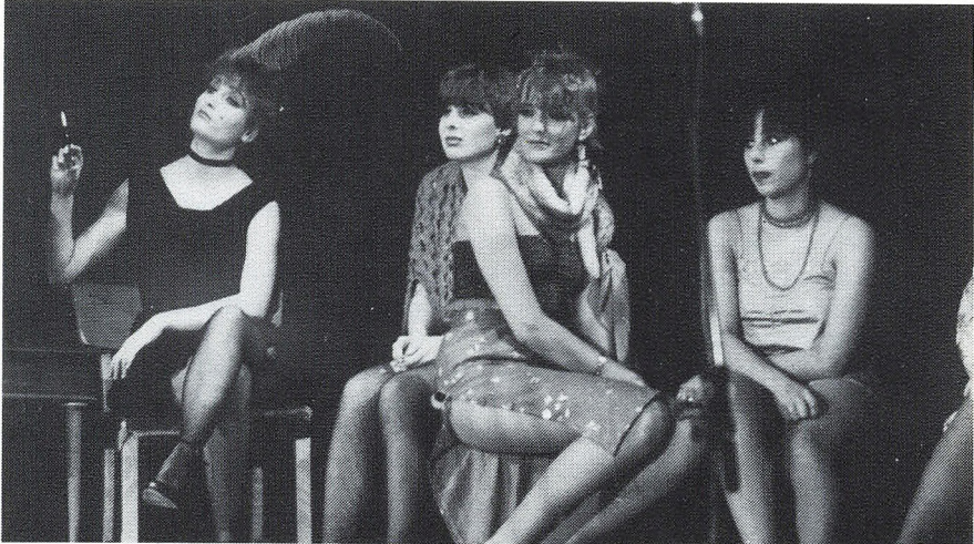
Fra "Laser og Pjalter".