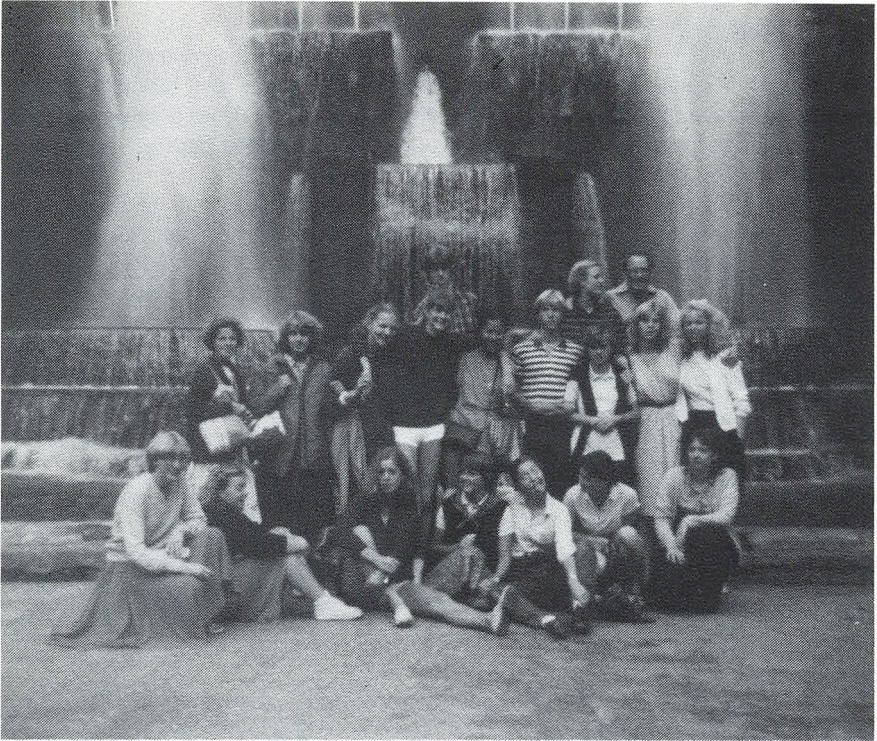
2a i Rom.

— sulten var midlertidigt stillet, og uden for var gaderne jo fulde af isboder og frugtstande. Dette blev den dags frokost. Man burde vel nævne i forbindelse med maden, at man i Rom serverer den dejligste vin til så billig en pris, at selv cola er dyrere!