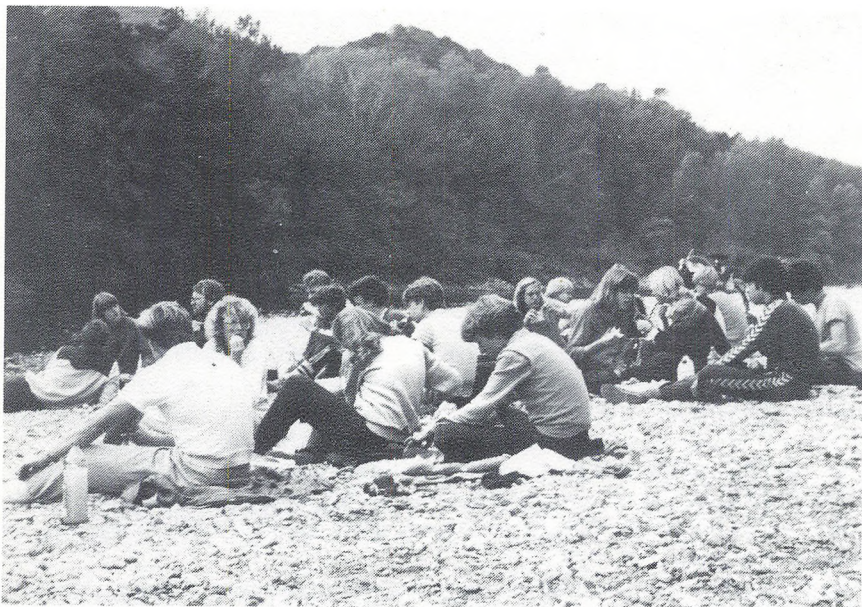
3z i Syd – Frankrig.

Søndag stiftede vi nærmere bekendtskab med Avignon, hvor vi så både bro, pavepalads, kirke og messedrenge. Desuden lærte russerne den livsnødvendige glose: VIN.