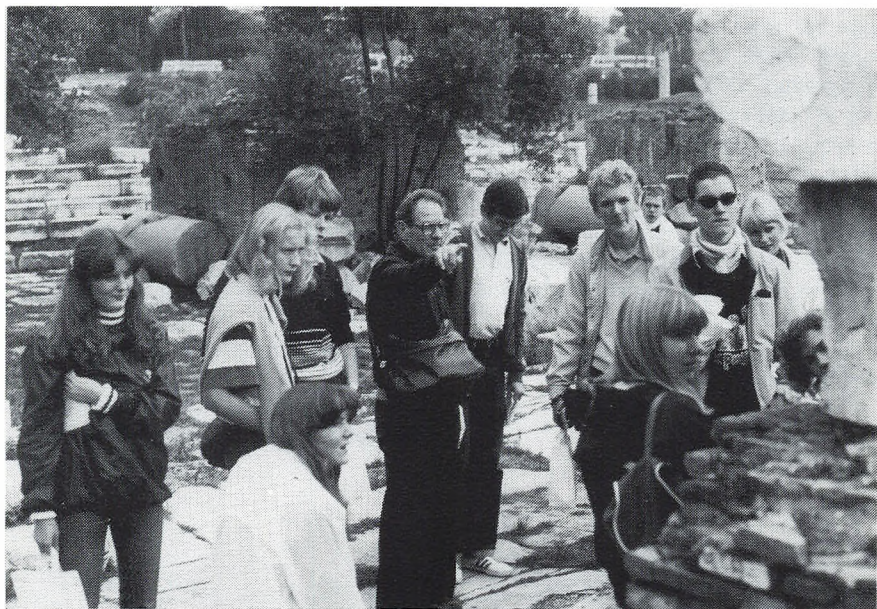
2x i Rom.