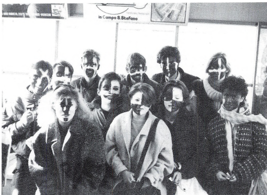
Karneval i Venedig