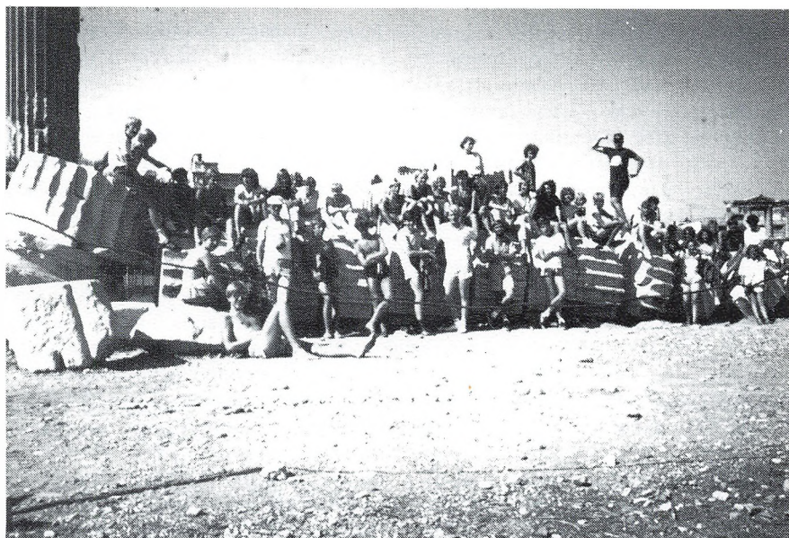
2 z i Athen