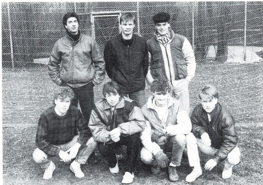
De sejrige 3 by'er