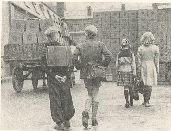
Paa Vej til „Skolen“

Skolegangsforholdene. Paa Skoleaarets første Dag, Paaskedag, blev Skolen beslaglagt til Brug for tyske Flygtninge, men ved Imødekommenhed fra en Række Institutioner, Fabrikker og Privathjem lykkedes det i Løbet af kort Tid at skaffe midlertidige Undervisningslokaler, saa alle Klasser — undtagen de nyindskrevne Førsteklasser — kunde faa mindst et Par Timers Undervisning om Dagen, i enkelte Tilfælde dog kun hveranden Dag.