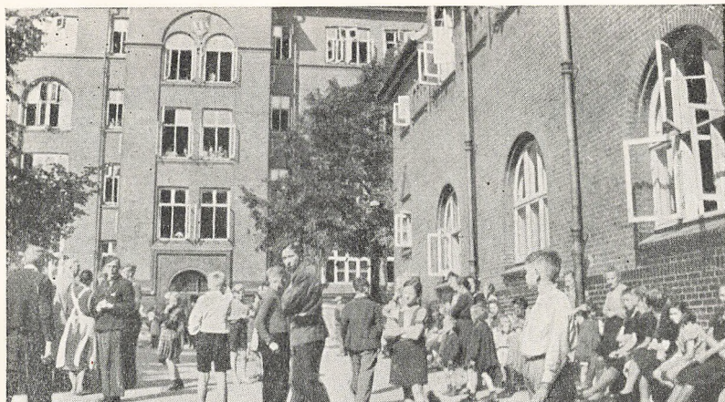
De tyske Flygtninge

3. April: Tyskernes Halm brænder, hvorved Halvtaget i Drengegaarden delvis ødelægges.