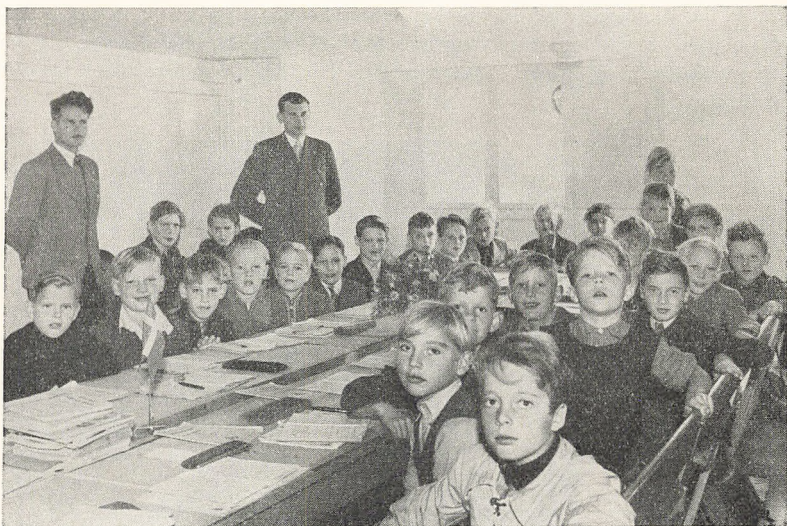
Skolestue paa Vagtelvej

Meddelelse om Grunden til et Barns Fraværelse bedes altid snarest til- stillet Klasselæreren, om muligt samme Dag. Meddelelsen bør helst være skriftlig, f. Eks pr. Brevkort — ikke telefonisk til Kontoret.