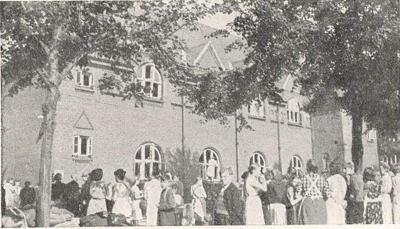
Tyskerne under Opbrud

2. Marts: Fastelavnsfest med Tøndeslagning for Eleverne fra 1.—3. Klasse.