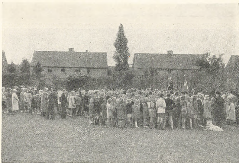
Afslutning paa Boldpladsen før Sommerferien 1945

kampen, og hvoraf 4 hviler i Ryvangen. Mange Forældre deltog i Morgensangen.