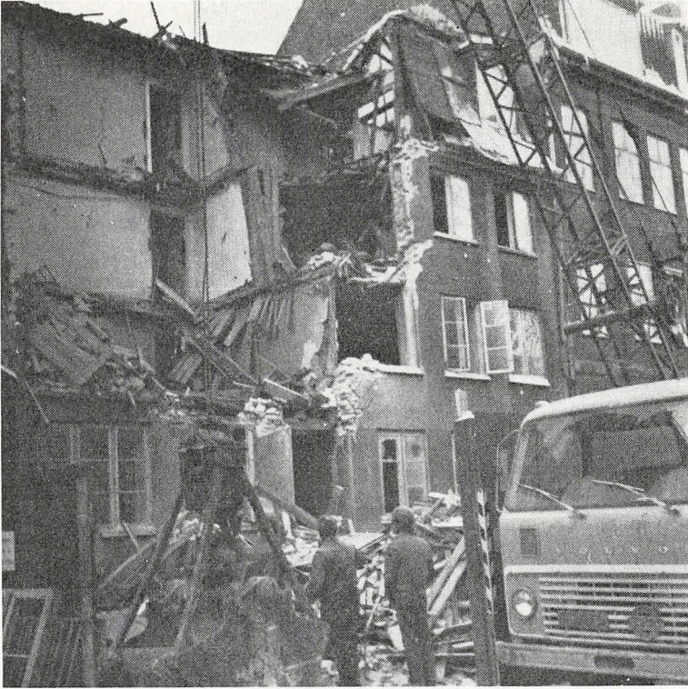
Skolens 174 års fødselsdag!

os igennem, hvor andre ville have givet op. Morgensang blev indskrænket til to gange om ugen, hvor vi lige får de vigtigste nyheder. Selv om året, der gik, har været fuldt af problemer, har det været et godt år.