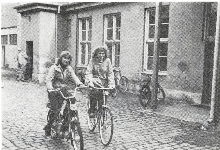
Hjem fra Strandgade