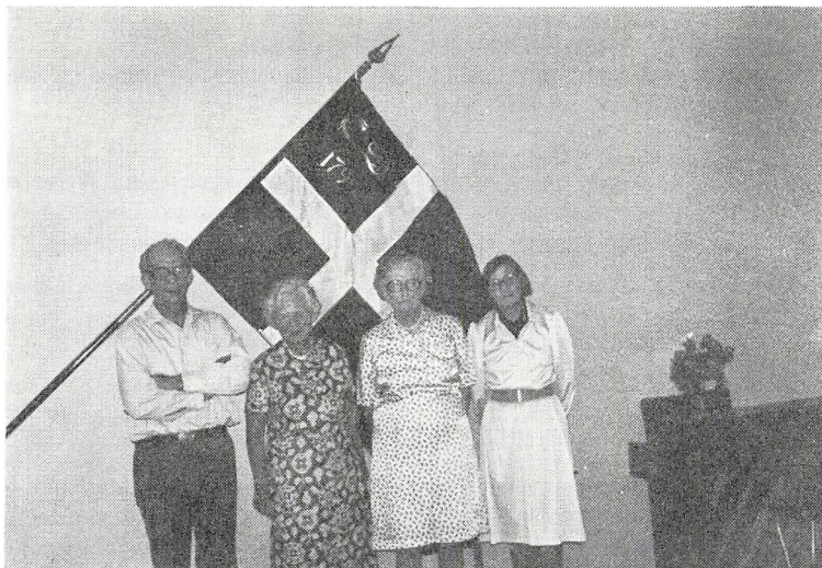
De fire vi tog afsked med