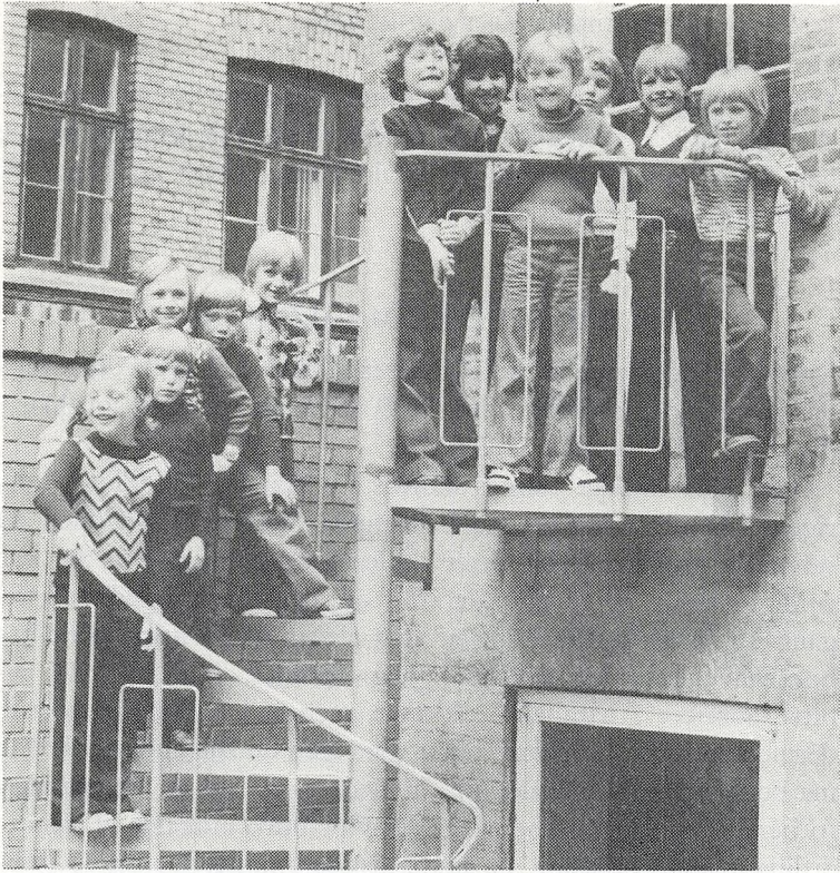
Drenge på Døttreskolen!

Ved alle ferier er de nævnte dage inklusive.