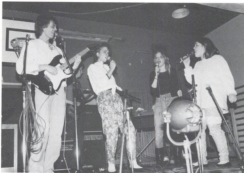
Fra forårskoncerten 1985.