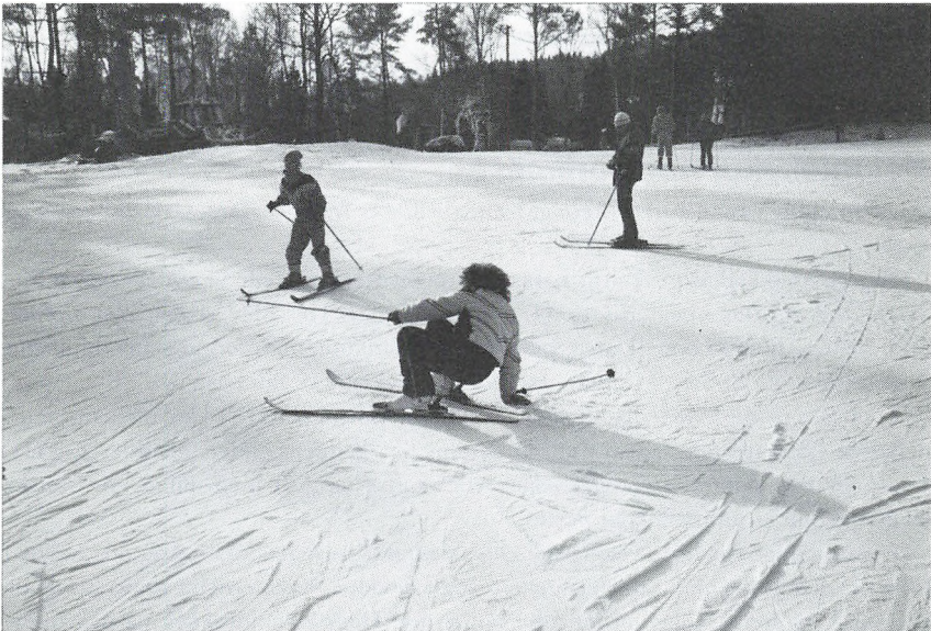
3. g's skitur

Færgeturen var ekstremt spændende. Vi sad og nikkede til hinanden hele vejen. Da