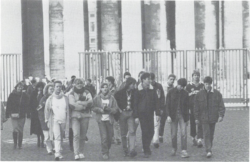
2. g's Romtur

forberede vores tur. Historisk set havde vi beskæftiget os med perioden fra Italiens samling og op til idag. Derudover havde vi hver især valgt en af Roms utallige seværdigheder og det var så meningen, at vi skulle fortælle om den, når vi kom til Rom. Dette gik i nogle tilfælde bedre end i andre.