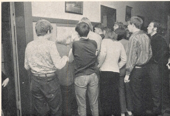
Opslagstavlen indeholder en nybed

Se, Breidablik betyder liv midt i døden, ikke efter, men midt i. Slå bare op i et leksikon: det sted, hvor Balder bor i dødsriget. Og dødsriget, det er nu, en lignelse om vir-