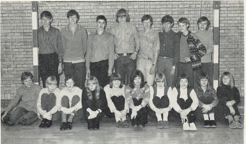
9. klasse A

Jeg glædede mig meget over at læse ovenstående digt. Håber at litteraturelskende læsere vil føje dette digt ind i deres „Aakjær-minder“, såfremt I ikke kendte det i forvejen.