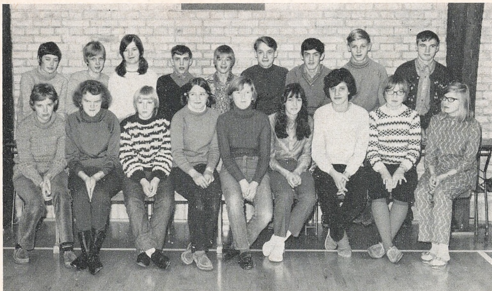
9. klasse B