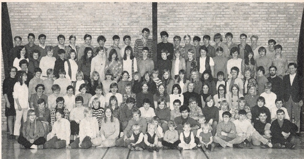
Så mange ialt . . .

andet – noget nutiden savner. Vi sagde du til ham. Vi tog heller ikke hatten af for ham, men han lærte os at tage den af for andre, der besøgte skolen. Vi lærte at rejse os op, når fremmede kom ind i skolen – uanset hvem personen var.