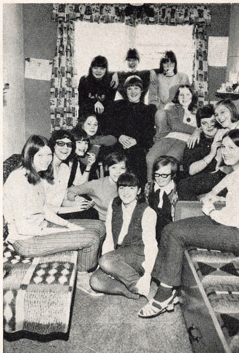
Piger i massevis ...