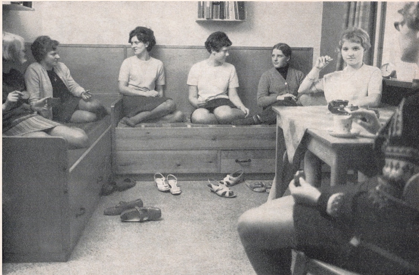
Et billede fra vort nye program. Hjælp med til at skaffe elever til din gamle skole.