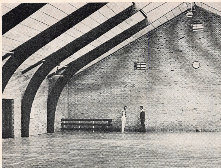
Et bjørne af den nye idrætshal.