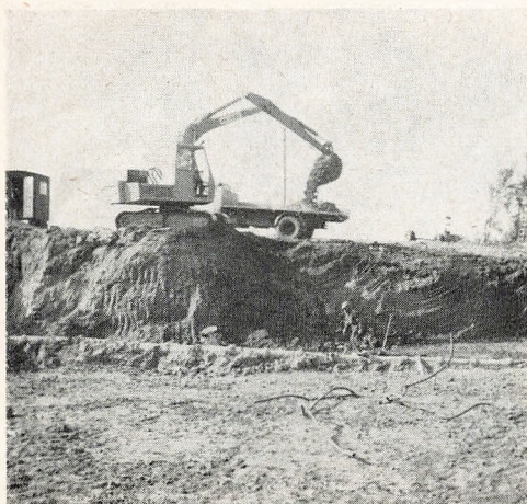
En stærk arbejdsmand.