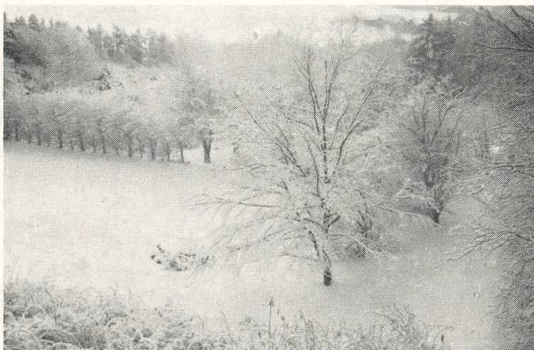
Haven i sne vinteren 65-66

Mens jeg sidder ved festmåltidet, flyver tankerne hid og did. Jeg tænker, at om få dage er julepynten væk. De fint pyntede butiksvinduer og gaderne med de mange lys bliver triste og grå. Faktisk bliver jeg lidt trist til mode. Hvad er der i grunden ved julen, når alt kommer til alt? Mon alle men-