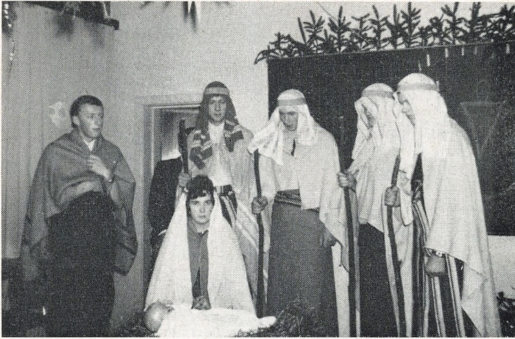
Eleverne opfører julespil