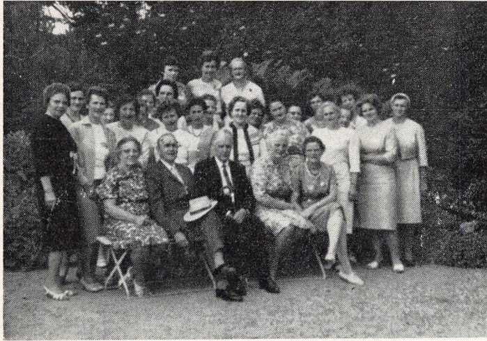
De taknemlige fra 41