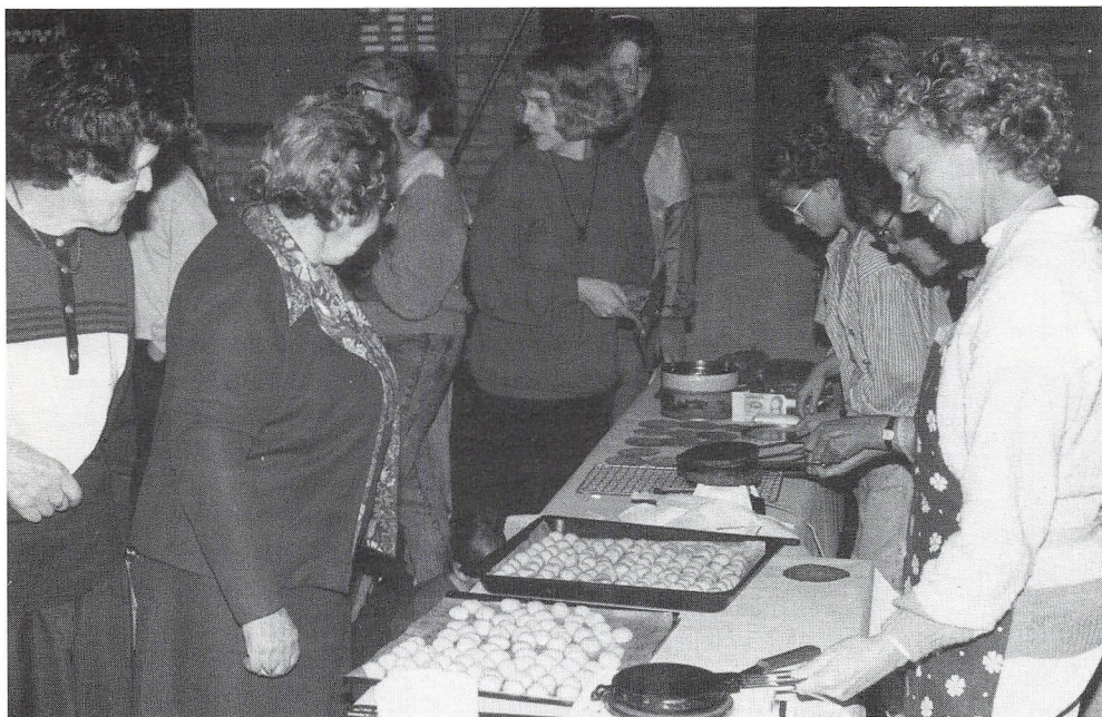
Fra DMS-basaren i hallen. Der sælges »gode råd«.