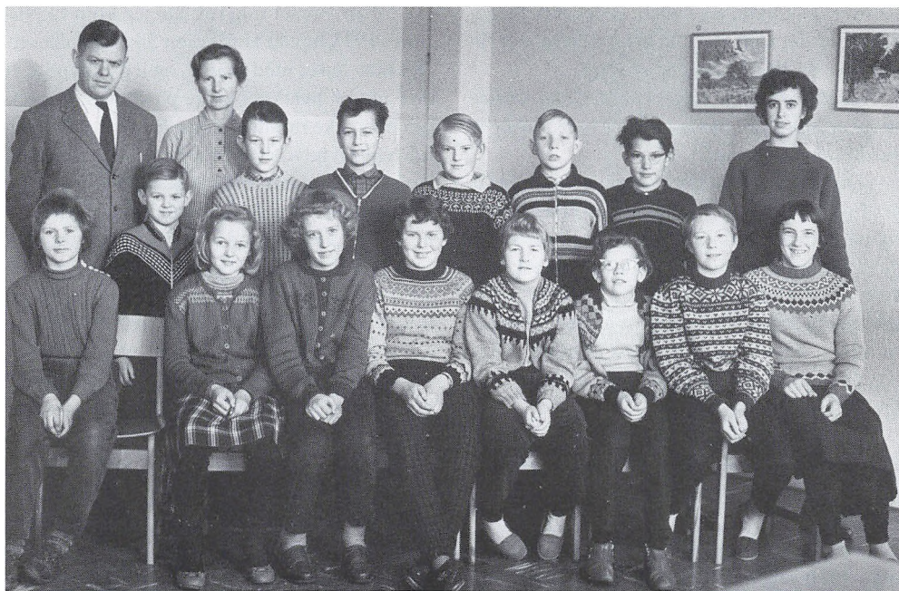
Fra tiden i Rom skole ved Lemvig.