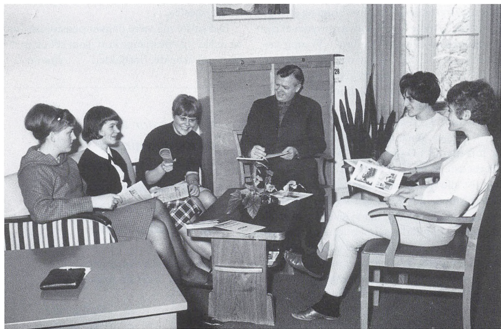
Fra Fårevejle Sygeplejehøjskole. Tingene drøftes med elevrådet.