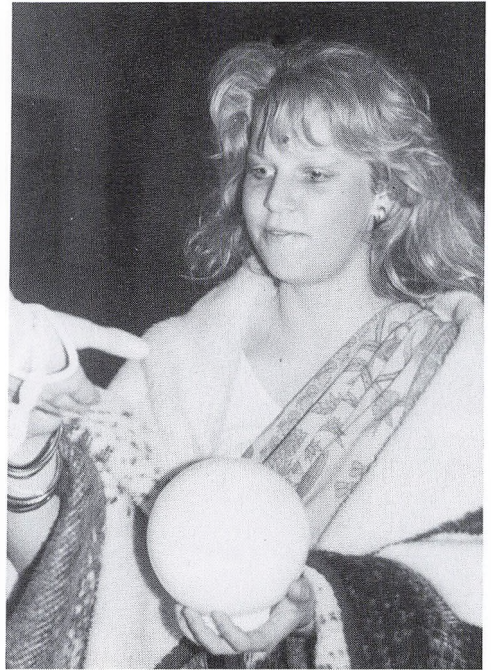
Hvad mon fremtiden bringer?

En-eller-anden blev vred over det, fordi det var Alles arbejde. Alle mente, at Enhver kunne gøre, men Ingen indså, at det ikke var Alle, der ville gøre det. Det endte med, at Alle bebrejdede En-eller-anden, at Ingen gjorde, hvad Enhver kunne have gjort!