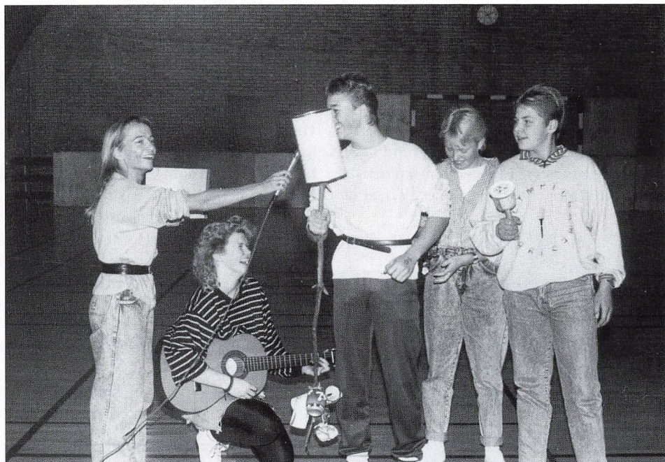
En søndagsspøg i hallen.