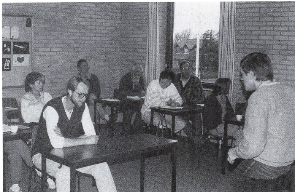
Lærerne på skolebænken