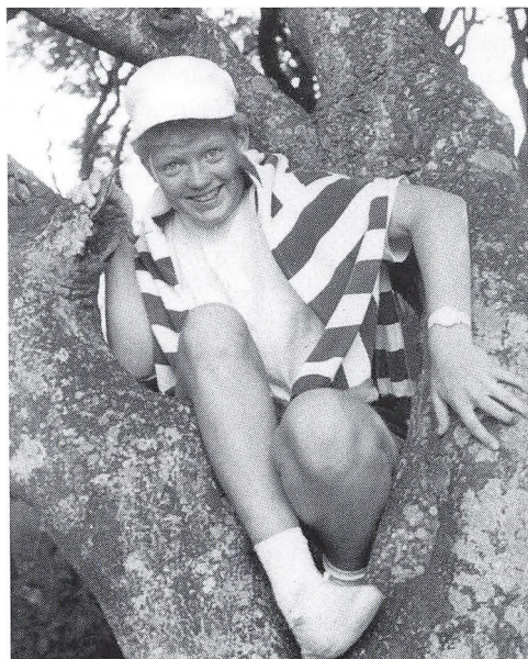
Lige i øjet (på træet).

Og gå så ud til livets krav, del ud af det, som Gud jer gav, og giv, som jer blev givet. Thi livets rigdom findes bedst af dem, der gir og elsker mest. Lev da med glæde livet.