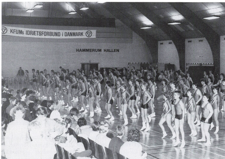
Fra gymnastikstævnet i Hammerum. (Foto: Brian S. Christensen, 10.b).