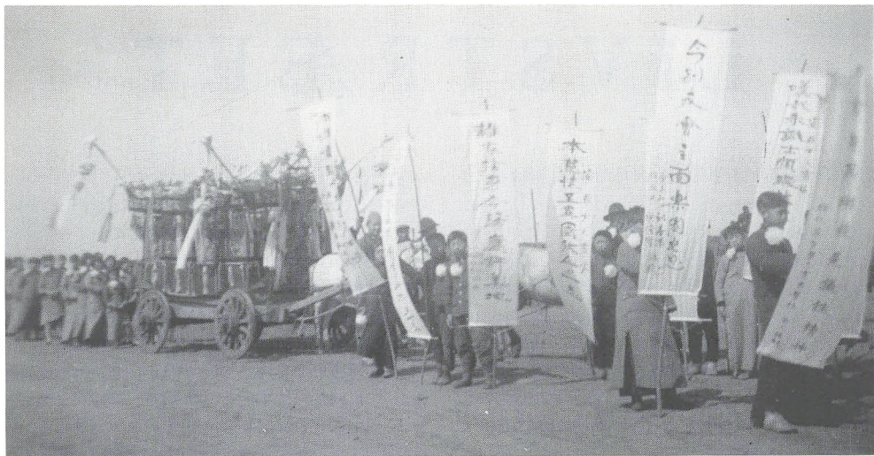
Kisten føres til gravstedet.