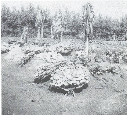
Gravstedet i Harbin.