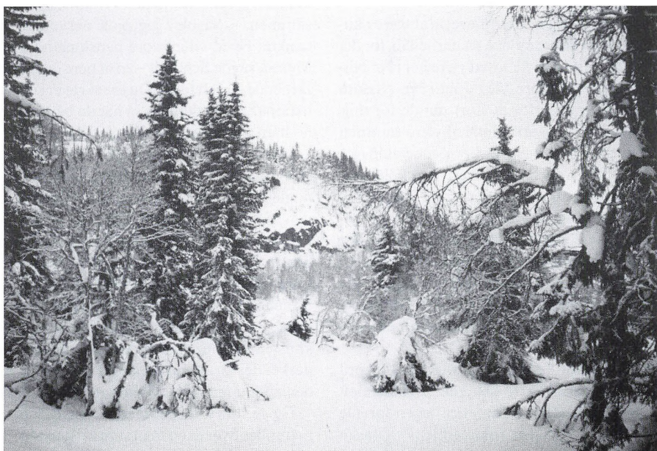
8. klasse i Norge.