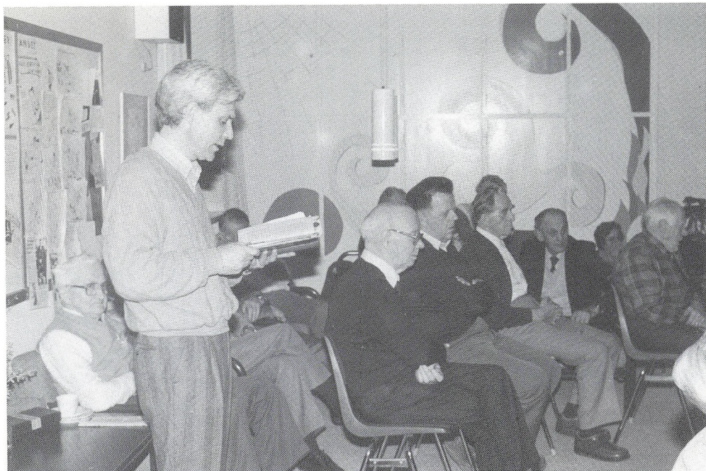
Fra förårskurset