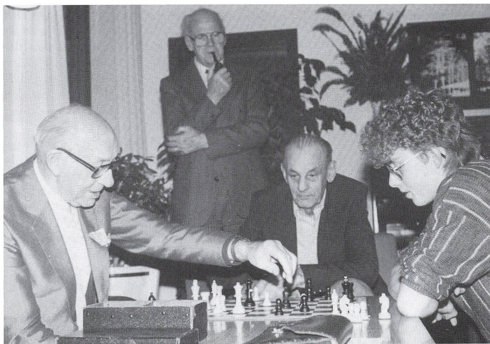
Fra forårskurset