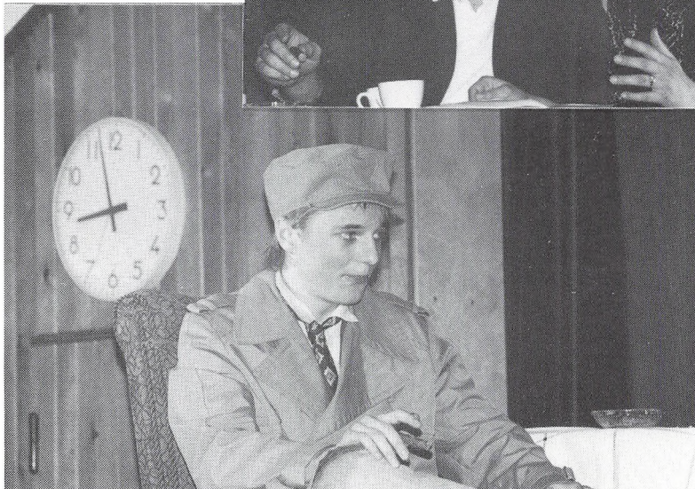
»10.a underholder forårskursisterne«.