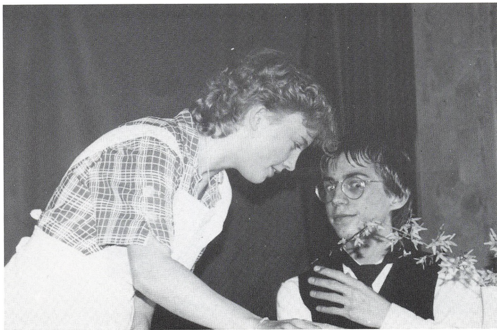
»10.a underholder kursisterne«.