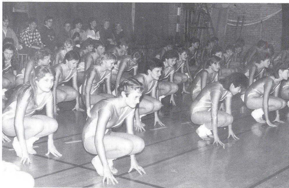
Fra gymnastikstævnet den 17. marts.